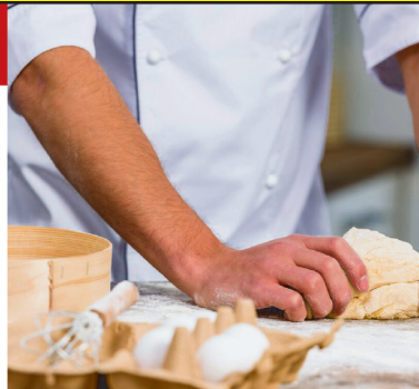
График работы: 5/2. Бесплатное питание.