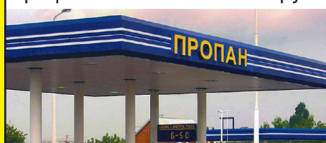
График 2/2. З/п от 55 000 руб.

г. Пермь, ул. Ижевская, 23в Тел. 8 951 930 82 52, e-mail: mail159@mail159.ru