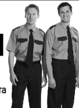
График: 1/2, вахта неделя через неделю Своевременная, достойная зарплата Соц. пакет

Тел.: 8-902-83-00-479, 8-902-63-06-705, 8-909-72-66-506