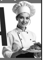
График работы 5/2 Тел. 8-902-79-79-473, 291-91-52

Требуется: ПОВАР-УНИВЕРСАЛ С возможностью временного трудоустройства. На лето. С опытом работы. График работы 5/2, с 07:00 до 15:30. Ул. Лодыгина, 34 Тел.: 241-44-14, 246-11-70